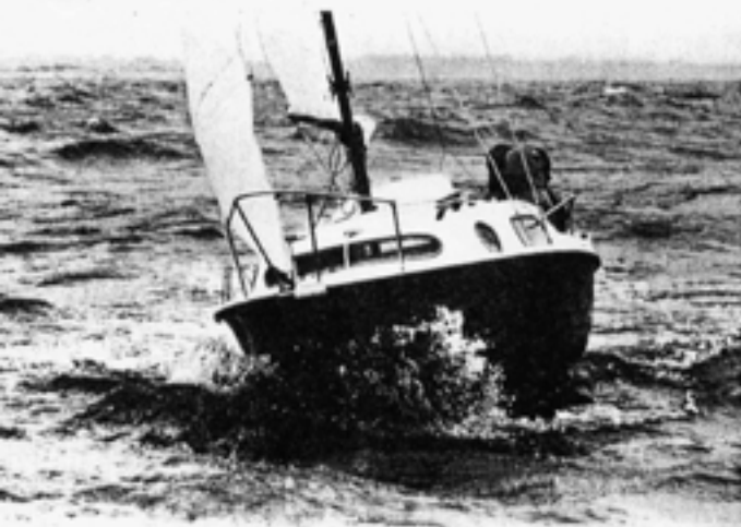
Der Rumpf setzt weich ein, und Spritzwasser kommt kaum an Deck. Nach kurzer Zeit hing die Fock allerdings durch – das Fall ist zu viel Reck.

Die Leisure 17 reagiert sehr leicht und schnell auf jeden Ruderausschlag, und so ist das Wendeverhalten fast jollenartig. Die zweite Überraschung dann draußen im freien Wasser – trotz der großen und steilen Wellen, hervorgerufen durch einen steifen Ostwind um 6 Beaufort